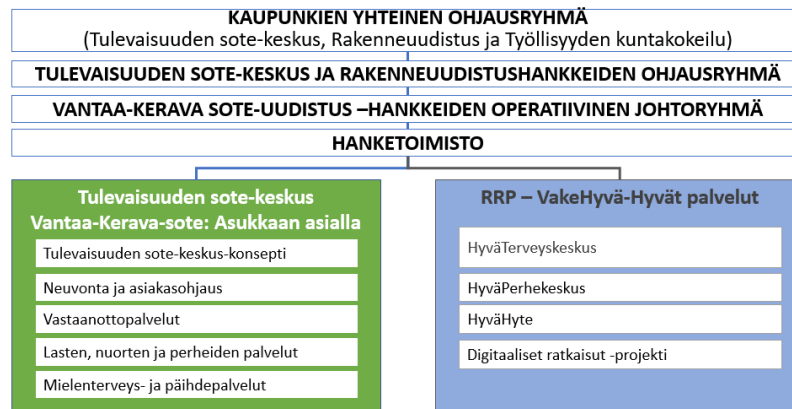
Kuva 5: Vantaan – Keravan hankeorganisaation rakenne.